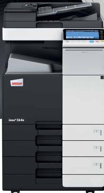
ineo+ 364e mit Papierkassette (PC-210) und Dual Scan Originaleinzug (DF-701),