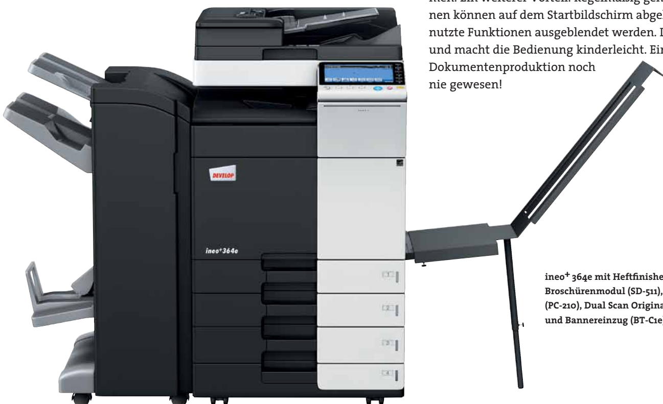
ineo+ 364e mit Heftfinisher (FS-534), Broschürenmodul (SD-511), Papierkassette (PC-210), Dual Scan Originaleinzug (DF-701) und Bannereinzug (BT-C1e)

Viele Multifunktionssysteme sind alles andere als anwenderfreundlich. Doch damit ist nun Schluss – die ineo+ 364e ist für Ihre Anforderungen wie geschaffen. Das Bedienungskonzept ist intuitiv erfassbar und genauso leicht verständlich wie das eines Smartphones oder Tablet-PCs. Der kapazitive 9 Zoll-Touchscreen verfügt über vertraute Funktionen wie flick, drag&drop und pinch in&out, sodass die Bedienbarkeit ganz einfach ist. Und dank der neuen Menüstruktur lassen sich alle Funktionen auf einen Blick erfassen und die gewünschten Einstellungen mit nur wenigen Berührungen vornehmen. Ein weiterer Vorteil: Regelmäßig genutzte Funktionen können auf dem Startbildschirm abgelegt, ungenutzte Funktionen ausgeblendet werden. Das spart Zeit und macht die Bedienung kinderleicht. Einfacher ist Dokumentenproduktion noch nie gewesen!