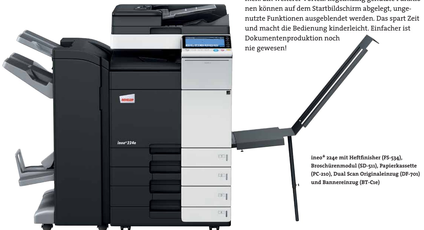
ineo+ 224e mit Heftfinisher (FS-534), Broschürenmodul (SD-511), Papierkassette (PC-210), Dual Scan Originaleinzug (DF-701) und Bannereinzug (BT-C1e)

Viele Multifunktionssysteme sind alles andere als anwenderfreundlich. Doch damit ist nun Schluss – die ineo+ 224e ist für Ihre Anforderungen wie geschaffen. Das Bedienungskonzept ist intuitiv erfassbar und genauso leicht verständlich wie das eines Smartphones oder Tablet-PCs. Der kapazitive 9 Zoll-Touchscreen verfügt über vertraute Funktionen wie flick, drag&drop und pinch in&out, sodass die Bedienbarkeit ganz einfach ist. Und dank der neuen Menüstruktur lassen sich alle Funktionen auf einen Blick erfassen und die gewünschten Einstellungen mit nur wenigen Berührungen vornehmen. Ein weiterer Vorteil: Regelmäßig genutzte Funktionen können auf dem Startbildschirm abgelegt, ungenutzte Funktionen ausgeblendet werden. Das spart Zeit und macht die Bedienung kinderleicht. Einfacher ist Dokumentenproduktion noch nie gewesen!